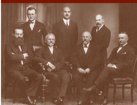
Opowieści o polskich ewangelikach