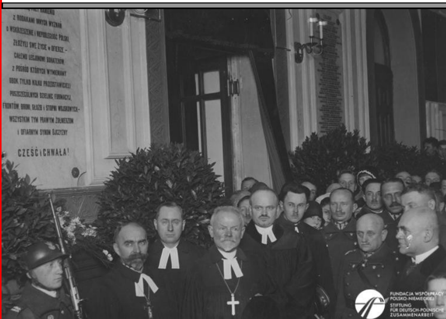
Odślonienie tablicy pamiątkowej na lotnisku mokotowskim w Warszawie ku czci poległych żołnierzy wyznania ewangelickiego